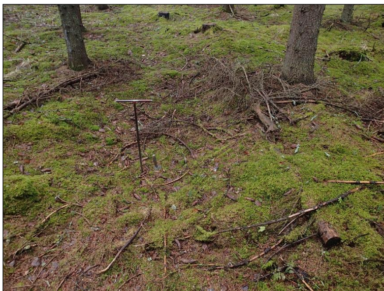
Hiilihauta D lännestä.