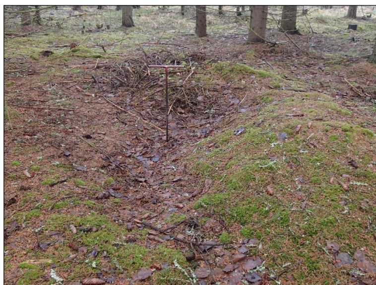
Hiilihauta A etelästä.

D) Samassa tasaisessa kuusikossa, kohdassa N 6960789 E 643610, todettiin kuoppa, jonka laajuus on 4 x 2 metriä ja syvyys 0,3 metriä. Sen eteläpuolella on matala valli. Kuopan pohjalle tehdyssä kairanpistossa todettiin hiilensekaista maata heti turpeen alla noin 12 cm:n syvyydelle. Kyseessä lienee hiilihauta.