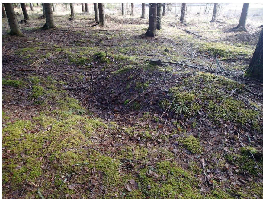
Hiihahauta B lännestä.