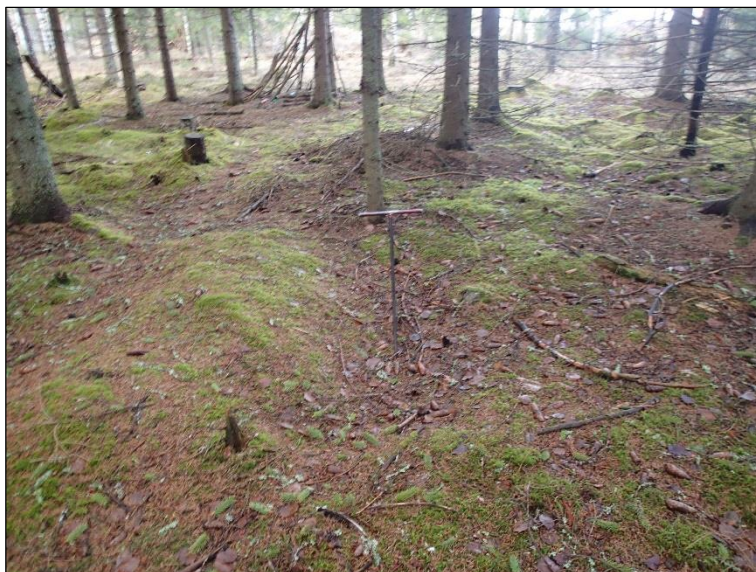
Hiilihauta C etelästä.